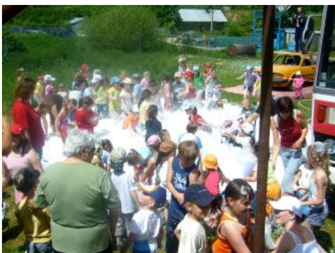
Deň detí s hasičmi