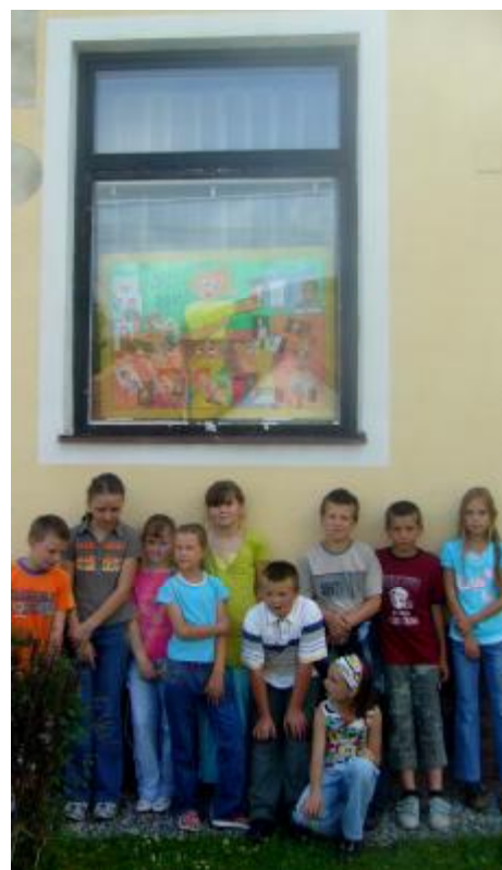
Štvrtáci so svojim tablom v okne OcÚ