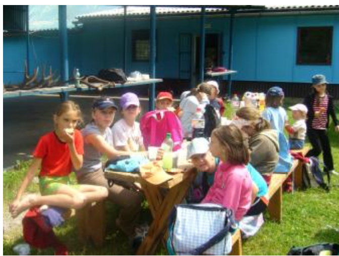
Deň detí s poľovníkmi