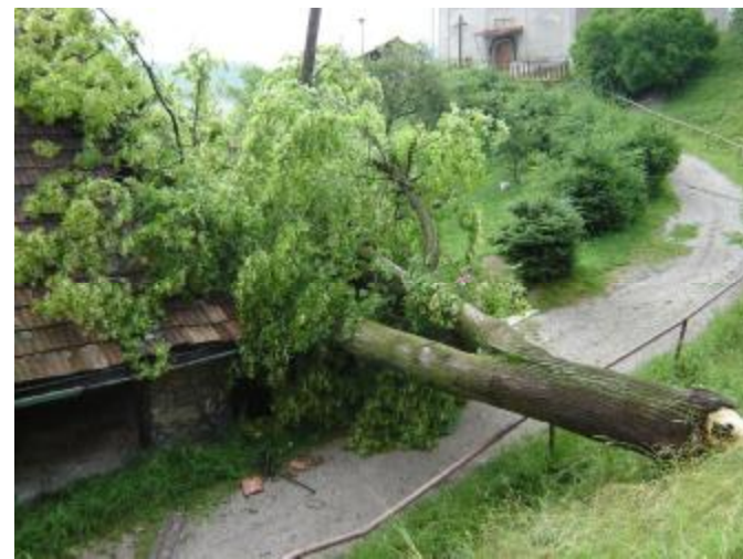
Júnová veterná smršť zlomila lipu pod kostolom