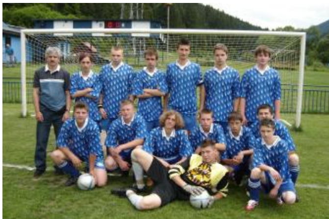
Súčasnú družstvo dorastu