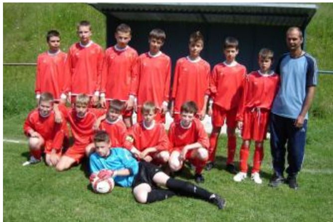
Nové družstvo žiakov