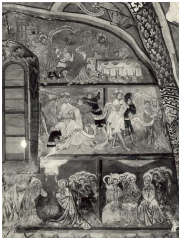
Južná strana svätyne