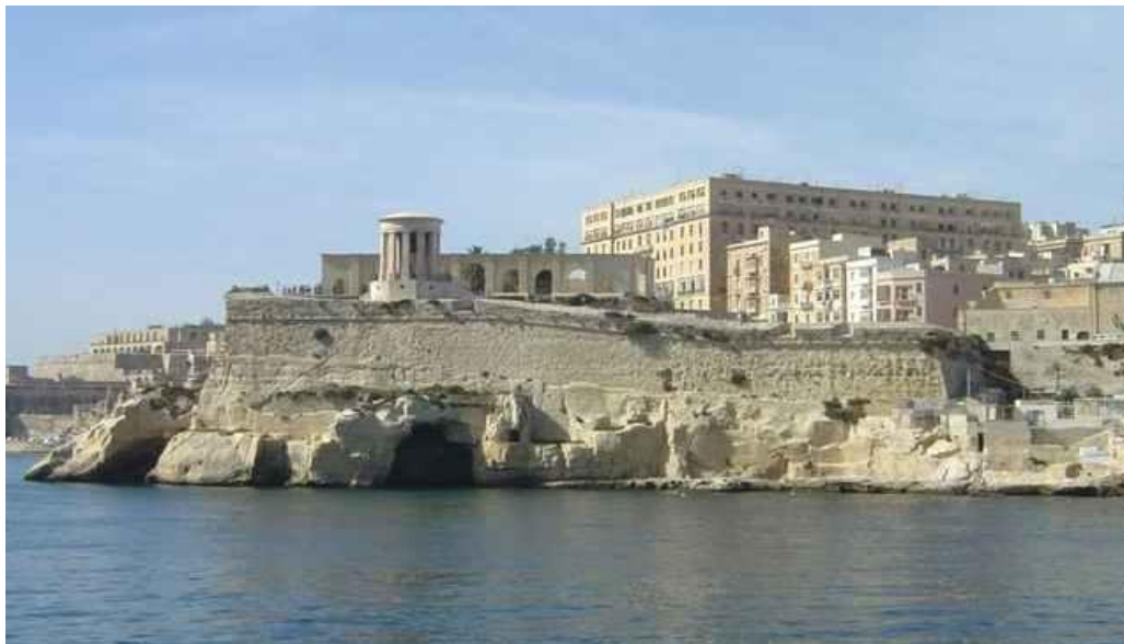
ostrov Malta a sv. Pavol

vyhnaných z ostrova Rhodos, stala sa najdôležitejšou baštou proti islamu a Turkom ohrozujúcich Európu. Johaniti silno ovplyvnili prístup obyvateľstva ku katolíckej viere. Križiaci vybudovali nedobytné opevnenia, proti ktorým sotva čo zmožol aj Hitler s celým technickým arzenálom, ale aj kostoly, paláce, hospice, ktoré doteraz nestratili svoj lesk a význam. To svedčí o pevnom a vytrvalom charaktere Malťanov, uznávajúcich hodnoty kresťanstva, v povinnosti starostlivosti o svojich starších najbližších príbuzných. Ich príklad je hodný nasledovania. Malťania majú starú reč z čias Féničanov, ktorá znie arabsko – taliansky. Pokojnosť a predovšetkým príslvečné pohostinstvo tvoria základný atribút Malťanov, ktoré vyzdvihol už sv. apoštol Pavol. Dúfajme, že napriek pribúdajúcemu turizmu a s tým spojeným napojením sa na ostatný svet si ostrov a jeho obyvatelia zachovajú spomínané hodnoty.