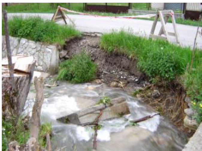
Májová povodeň zničila oporný múr potoka