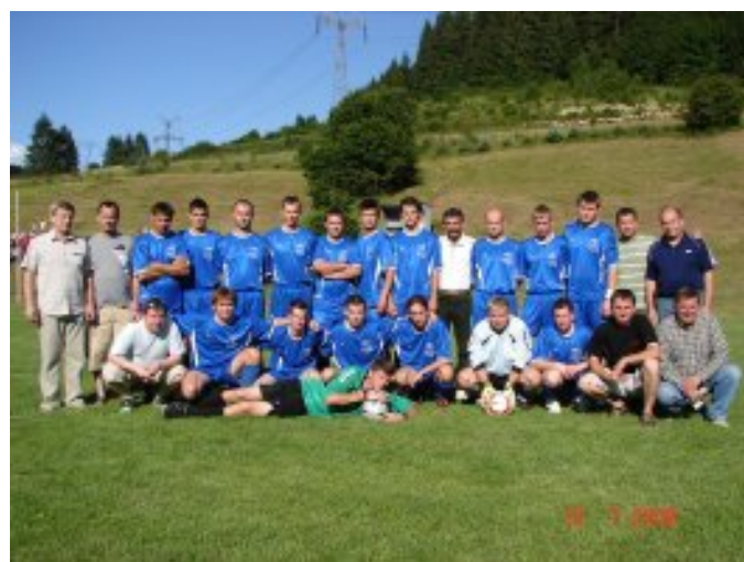
Futbalový turnaj „O pohár starostu obce“ – II. ročník