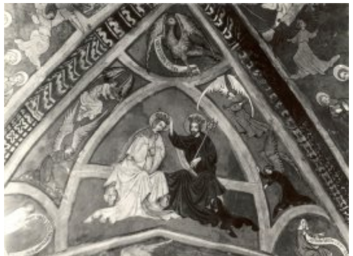
Korunovanie Panny Márie

Klenebné polia sú opatrené maľbami, v južnom je figurálna kompozícia šiestich apoštolov, obdobne ako v severnom. V západnom poli je Korunovanie Panny Márie a vo východnom Kristus – Kráľ po stranách s Máriou a Jánom. V rohoch sú vyvolení na jednej strane a zatratenci na druhej strane. Pri svorníku sú atribúty evanjelistov, Sv. Ján, Sv. Marek a Sv. Matúš. Maľba pred opravou v XX. storočí bola v tak zlom stave, že dnešný stav možno považovať za premaľbu. Tieto maľby boli akademickým maliarom Hanulom tak reštaurované, že retuš bol zavedený až do premaľby takmer celých plôch. Farebná kompozícia je v súlade s obvodovými stenami. Podľa archívnych údajov je známe, že časť južného poľa bola celkom prepadnutá a táto časť bola akademickým maliarom Hanulom re-