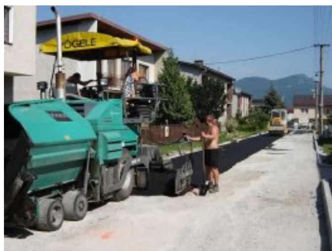
Nová cesta na ulici Pod cintorínom – august 2008