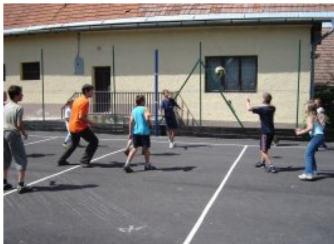
Otvorenie viacúčelového ihriska pri PZ