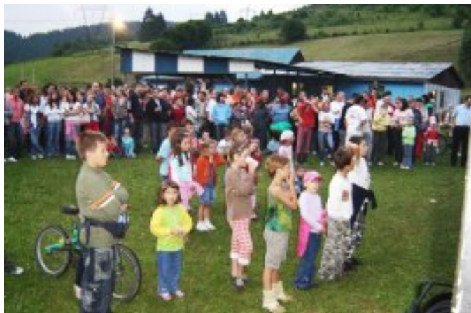
Vystúpenie skupiny Ploštín Punk – júl 2008