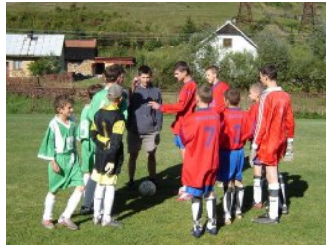
Miništrantský futbalový turnaj – september 2008

Vydáva Obec Ludrová. Redakčná rada občasníka: Peter Dutka (pd), Jozef Janiga (jj), Jozef Vandák (jv), Mgr. Soňa Firicová. Sadzba: RNDr. Dušan Dírer. Redakcia občasníka má sídlo na Obecnom úrade v Ludrovej.