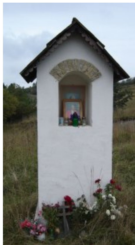
Redakcia Kaplnka na Bielej Púti