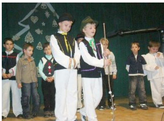
Predvianočné stretnutie dôchodcov 2009