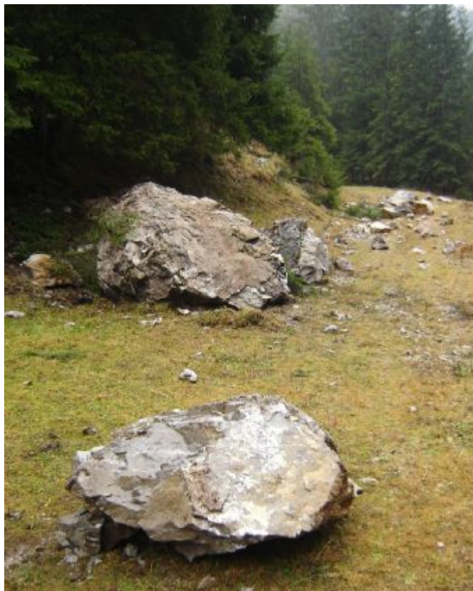
Spadnuté skaly pred Smrekovou

V závere tejto dolinky je malá, ale úhľadná polianka nazývaná Žiariky . Na tejto polianke do roku 1940, býval sliačanský salaš. Pre zlý prístup na polianku a malé množstvo pašienkov bola hola zrušená. Neskoršie si tam poľovníci postavili krmelec pre zverinu. Ponad túto polianku cez Žiariky vedie turistický chodník, ďalej cez Lučivnú a cez Moldavu ďalej ku dedine. Od dolinky Lučivná, smerom dolu prechádzame popod rúbaniská nazývané Priehaliny a prídeme ku môtstiku. Popodeň tečie malý potôčik z dolinky Svinia . Poníže tejto dolinky sa rozprestiera asi 60 ročný porast lesa na úbočí Moldavy. Taký názov má aj celá pomerne dlhá a rozložitá dolinka. Na jej južnej strane na vrchole sa nachádza malá náhorná plošina nazývaná Kasne . V minulosti tam býval štiavnický salaš. Od Moldavy nadol prídeme ku skalnatej dolinke Vápenica . V tejto dolinke v rokoch 1812 až 1878, pálili z vápencových skál vápno, na stavbu kostola aj školy. Asi o stopäťdesiat metrov nižšie, hneď vedľa cesty je pomerne veľký prameň čistej vody, ktorá putuje popod zem až spod tiesňavy