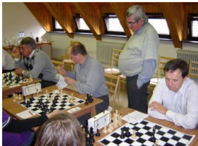
Prvý šachový zápas