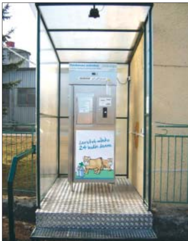
Mliečny automat nájdete v Štiavničke, v areáli PD Ludrová - stredisko mechanizácie.