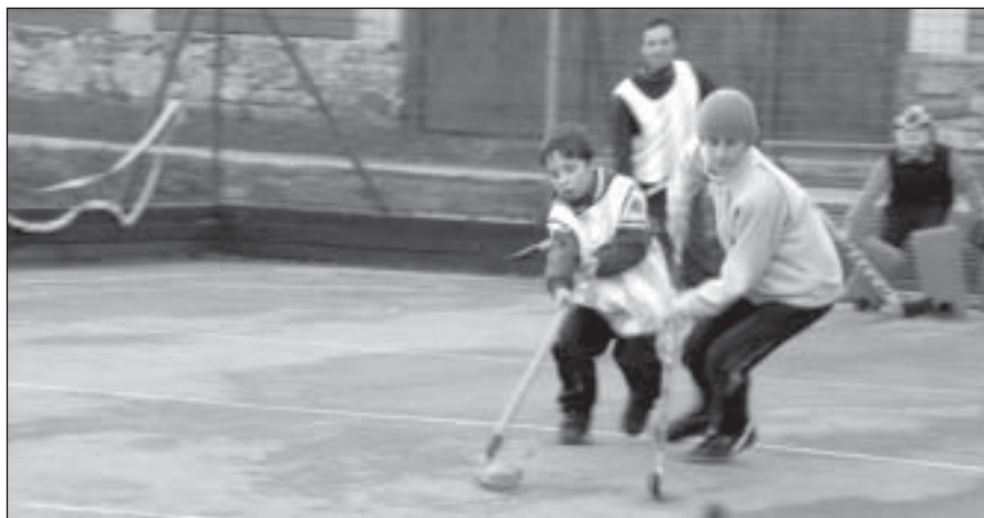
Snímka zo zápasu Farskej hokejbalovej ligy (hore). Víťazné družstvá súťaže (dole).